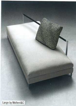
Large by Molteni&C