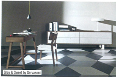
Gray & Sweet by Gervasoni

FENIX BY DRIADE. Klare, einfache Linien und großer Detailreichtum kennzeichnen das modulare Sitzsystem Fenix, um das das famose Design-Duo Ludovica und Roberto Palombo die Kollektion 2012 des Herstellers Driade bereichert. Sie vereinen Weichheit, Komfort und Minimalismus zu einem einzigartigen Sofa. Kontrastierende Materialien kennzeichnen den ästhetischen Eklektizismus des Designs – Stoff für Sitz- und Rückenpolster, Leder für Armlehnen und das gegurtete Untergestell. Die Metallstruktur der kreuzförmigen Beine hellt die visuelle Wirkung des oberen Teils des Sofas, schafft ein Stück, das sowohl kraftvoll wie unaufdringlich ist. www.driade.com