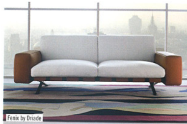
Fenix by Driade